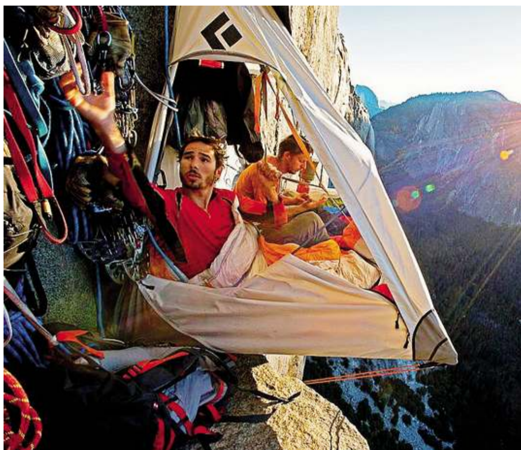
L'esperienza della «Notte sospesa» in tenda: ora si può vivere anche a San Simone